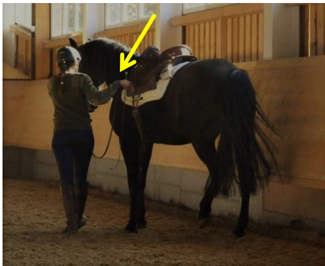
Linke Hand. In der rechten Hand befindet sich der äußere Zügel und die Gerte.

Die rechte Hand fasst den äußeren Zügel, der über den Hals auf die linke Seite geführt wird. Der rechte Arm wird locker nach unten-hinten hängen gelassen, ohne dabei zu verkrampfen. Die Gerte wird immer in der Hand geführt, die den äußeren Zügel führt. Körper und Blick sind nach vorne gerichtet.